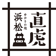
B-1 モノクロバージョン